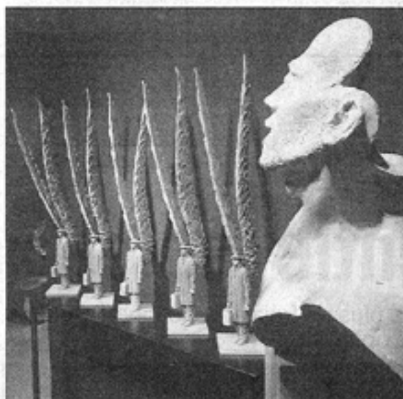
La galerie Wagner-Derrière la Dune, a une nouvelle fois ébloui par la beauté de ses tands et l'originalité de ses artistes...