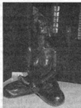
« Turban » de la Touquet-toise Domitille Arnout